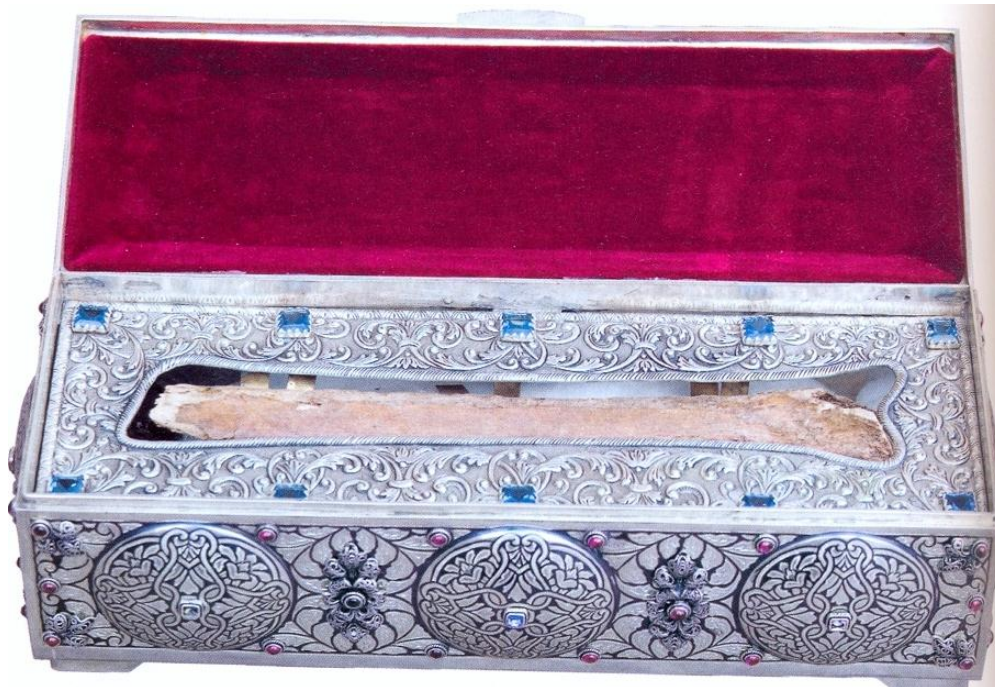
Μέρος τῶν λειψάνων τοῦ ἁγίου Μαξίμου τοῦ Γραικοῦ, ἀποθησαυρισμένον εἰς τὴν Ἱερὰν Μεγίστην Μονὴν τοῦ Βατοπαιδίου.