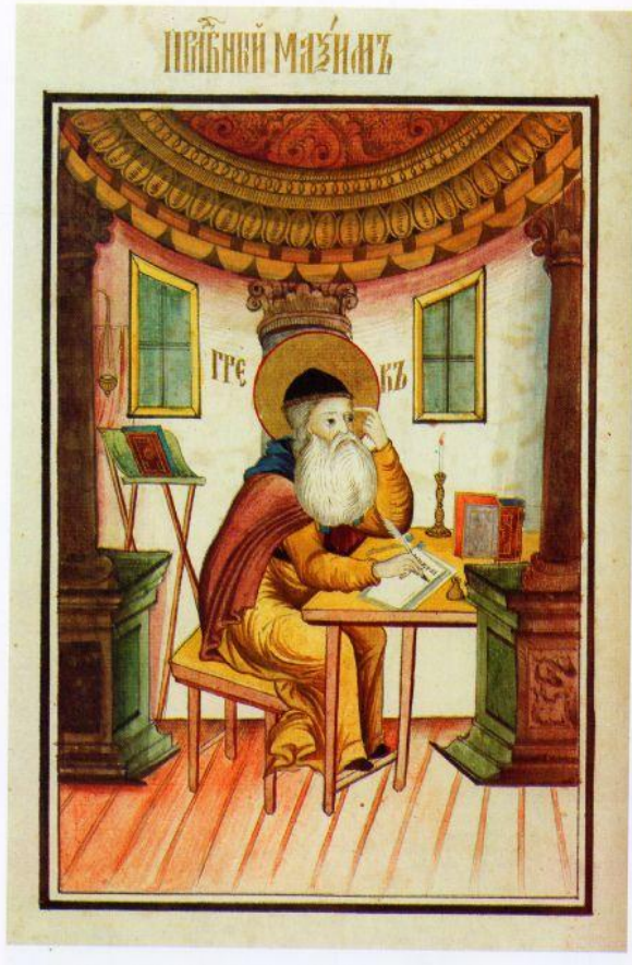
Ὁ ἅγιος Μάξιμος ὁ Γραικός, Γέροντας τοῦ ἁγίου νέου Ὁσιομάρτυρος Σιλβανοῦ.