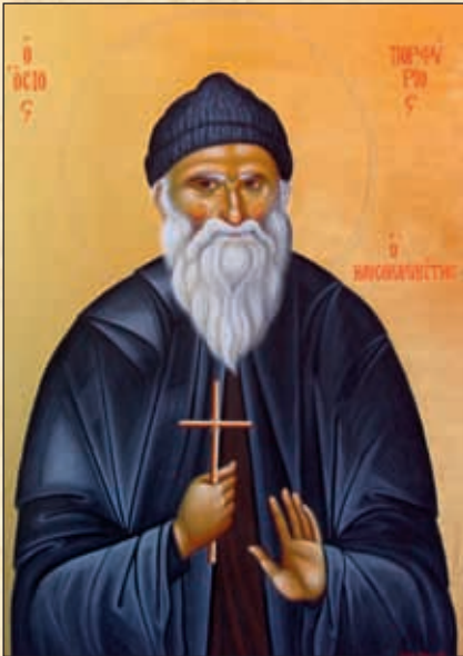
Πορφύριε οἰκουμένης, πάσης, ποιμὴν ἡμῶν καὶ στήριγμα.