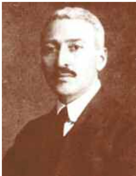
Ο Ίων Δραγούμης.

Η βία αυτή των μοναρχικών θα προκαλέσει στη