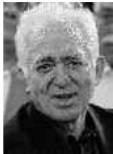
Του Γιώργου Καραμπελιά*

Ο Αθανάσιος Σουλιώτης-Νικολαΐδης γεννήθηκε το 1878 στη Σύρο από οικογένεια με σουλιώτικη καταγωγή. Το 1900 τελείωσε τη Σχολή Ευελπίδων. Το 1906, ανθυπολοχαγός του πεζικού, υπό το κάλυμμα του εμπορικού αντιπροσώπου οργάνωσε στη Θεσσαλονίκη την Οργάνωση Θεσσαλονίκης για την αντιμετώπιση της βουλγαρικής προπαγάνδας και το 1908 την Οργάνωση Κωνσταντινουπόλεως , η οποία έως το 1912-13 έφθασε τα 500 μνημένα μέλη. Μετά το νεοτουρκικό κίνημα δημιουργήθηκε και ο Ελληνικός Πολιτικός Σύνδεσμος Κωνσταντινουπόλεως . Σε αυτόν συμμετείχαν και πολλοί Έλληνες, ιδιαίτερα Μακεδόνες, βουλευτές του οθωμανικού κοινοβουλίου. Συνολικά από τους 26 Έλληνες βουλευτές που συμμετείχαν στην πρώτη οθωμανική Βουλή του Δεκεμβρίου 1908, μύση τους 16. Ως όργανο του Πολιτικού Συνδέσμου ίδρυσε μαζί με τον Ίωνα Δραγούμη και τον Γ. Μπούσιο στα 1910 την Πολιτική Επιθεώρηση , την οποία έκλεισαν οι Νεότουρκοι το 1913 και συνέχισε να επανεκδίδεται μετά το 1916 στην Αθήνα. Το 1920 εκλέχτηκε βουλευτής Θεσσαλονίκης και το 1935 γενικός διοικητής Θράκης. Πέθανε το 1945. Μετά τον θάνατό του δημοσιεύτηκαν τα: Μακεδονικός Αγών. Η Οργάνωση Θεσσαλονίκης 1906-1908 (1959), Ημερολόγιον του Πρώτου Βαλκανικού Πολέμου (1962), Γράμματα από τα Βουνά, Σημειωματάριον (1971) και Οργάνωση Κωνσταντινουπόλεως 2 (1984). Ο Σουλιώτης-Νικολαΐδης και ο Δραγούμης δέθηκαν με ισχυρότατους δεσμούς. Η δράση και η σκέψη τους ήταν τόσο κοντά, ώστε να αποτελούν έναν Ιανό που συνδύαζε συ-