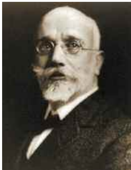
Ο Ελευθέριος Βενιζέλος.

Η αντίθεση του μοναρχικού χώρου στην προσπάθεια της απελευθέρωσης των Ελλήνων της Ανατο-