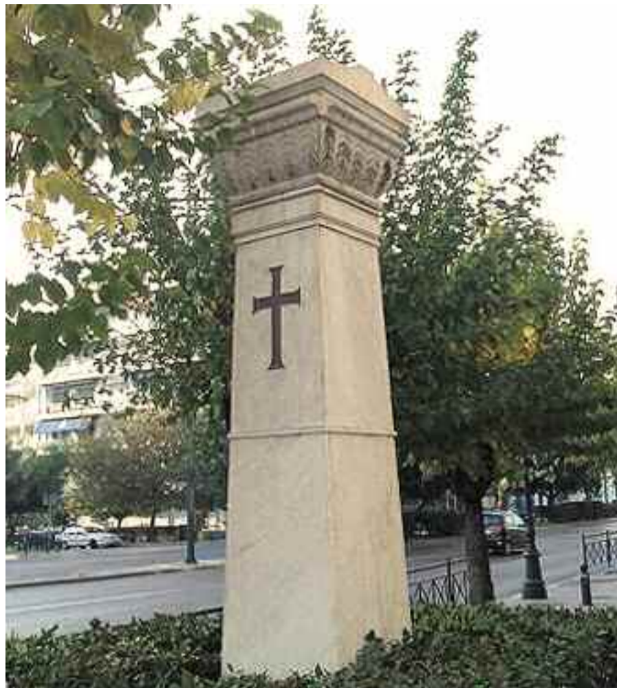
Το μνημείο που έχει σπθεί στο σημείο της εκτέλεσής του Ι. Δραγούμη απέναντι από το ξενοδοχείο «Χίλτον».

Τον Αύγουστο του 1909 εκδόθηκε το βιβλίο του «Σαμοθράκη».