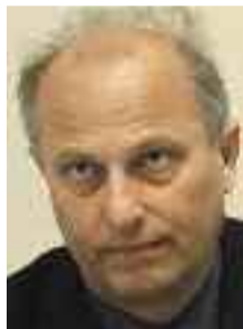
Του Βλάση Αγτζιδιθ* www.agtzidis.gr

θεσης. Αυτής των χριστιανικών λαών της οθωμανικής αυτοκρατορίας με τον милитарιστικό τουρκικό εθνικισμό. Ο Δραγούμης θα παραγνωρίσει πλήρως τη νέα αποφασιστική παράμετρο που προστίθεται στη δύσκολη εξέλιξη των διαδικασιών μετασχηματισμού της περιοχής μας, τον τουρκικό εθνικισμό, όπως θα εκφραστεί στο πρόσωπο των Νεότουρκων με το στρατιωτικό κίνημα του 1908. Θα παρασυρθεί και ο ίδιος από τις πλαστές επικλήσεις των συνθημάτων του γαλλικού Διαφωτισμού και θα επενδύσει στη νεοτουρκική πολιτική πρόταση. Ακριβώς γι' αυτό θα αντιπαχθεί στη νέα πολιτική παμβαλκανική αντινεοτουρκική συμμαχία που θα εγκαίνιασει ο Βενιζέλος, ο οποίος, ως προερχόμενος από την πρόσφατα απελευθερωμένη Κρήτη, κατανοεί τις πραγματικές αντιθέσεις.