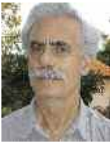
Του Χ.-Δ. Γουνελά*

Τ ο πατριωτικό αίσθημα των διανοομένων στην Ελλάδα μετά την ήττα του 1897 ήταν διαφορετικό από αυτό που συναντάει κανείς στους διανοούμενους υποστηρικτές της Μεγάλης Ιδέας πριν από τον πόλεμο.