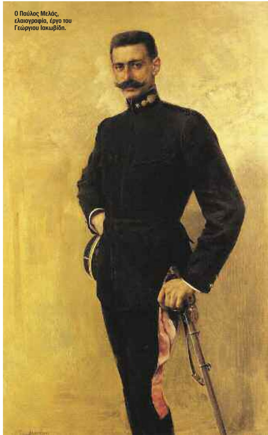
Ο Παύλος Μελάς, ελαιογραφία, έργο του Γεώργιου Ιακωβίδη.

Όλ' αυτά πέφτουνε τώρα, γκρεμίζονται με την ελευθερία του Ελληνικού κράτους, που μας έκανε κορόιδο, χάσαμε την πίστη μας σ' αυτά που μας έλεγαν οι Φιλέλληνες, οι Γραμματισμένοι και οι Φαναριώτες, και μαζί χάσαμε