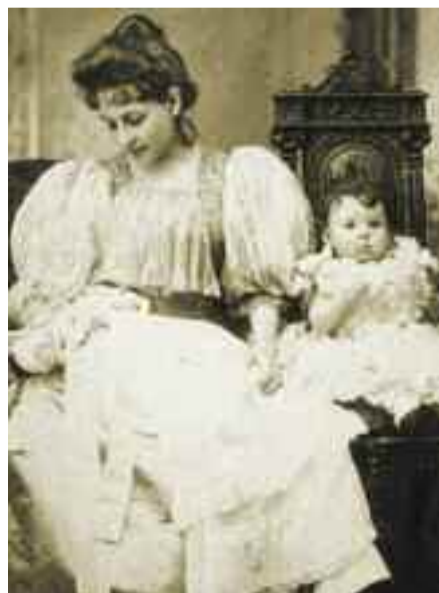
Η Πηνελόπη Δέλτα.

Από την κεντρική υπηρεσία του υπουργείου Εξωτερικών, στην οποία μετατέθηκε μετά την πρεσβεία της Κωνσταντινούπολης, διορίστηκε το 1909 στην πρεσβεία της Ρώμης και ακολούθως στο Λονδίνο. Το 1910